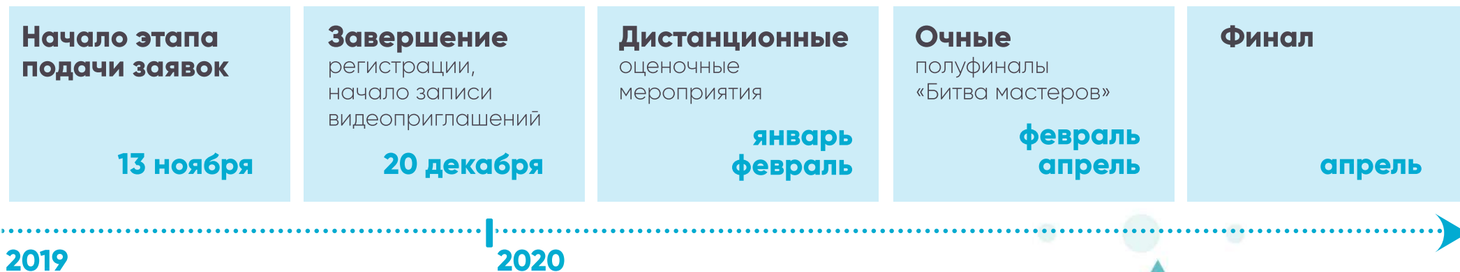
ГРАФИК ПРОВЕДЕНИЯ КОНКУРСА